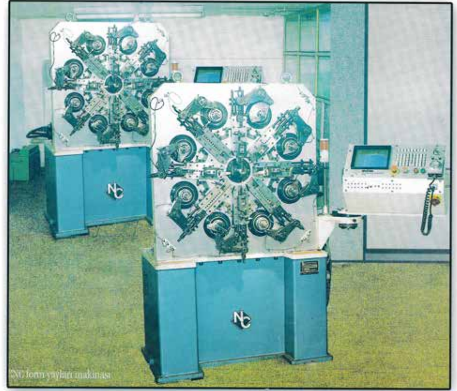
NC form yayları makinası

1975 yılından bu yana ilk günkü heyecanımızı yitirmeden, ilkelerimizden ve kalite standartlarımızdan ödün vermeden bugünlere gelmenin gururunu taşıyoruz.